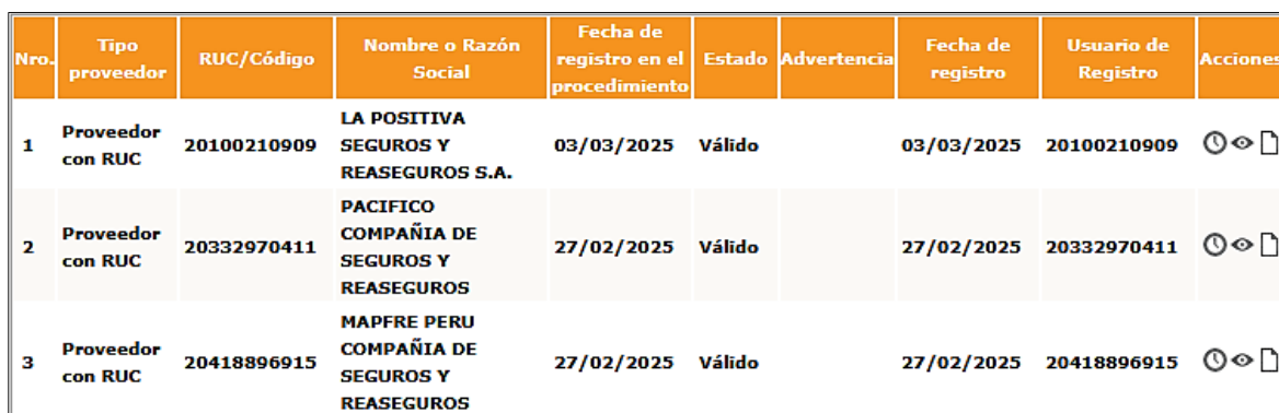
CUADRO N° 01

De acuerdo con el cronograma establecido en el portal del SEACE, se da cuenta del registro electrónico de participantes inscritos: