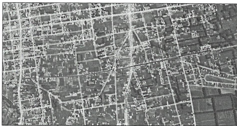
Figura 02. Vía a intervenir Jr. Alfonso Ugarte del distrito de Huancán