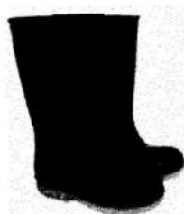
Botas de Jefe