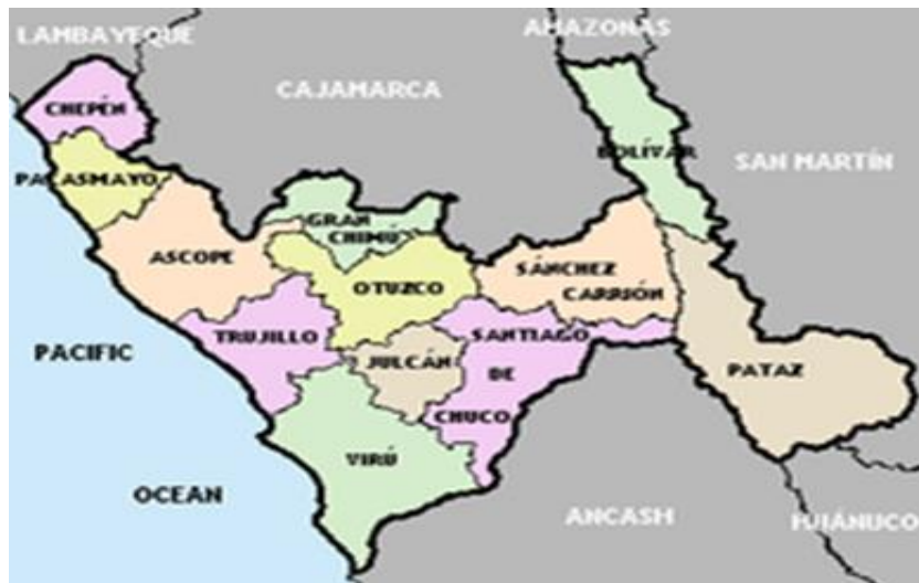
Figura 1.- Ubicación de la Provincia de Ascope