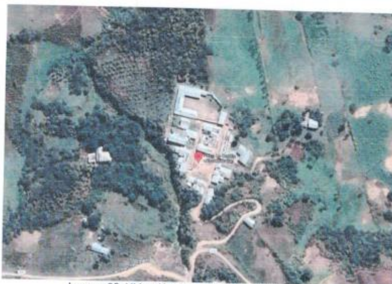
Imagen 02: Ubicación del Proyecto zona Urbana