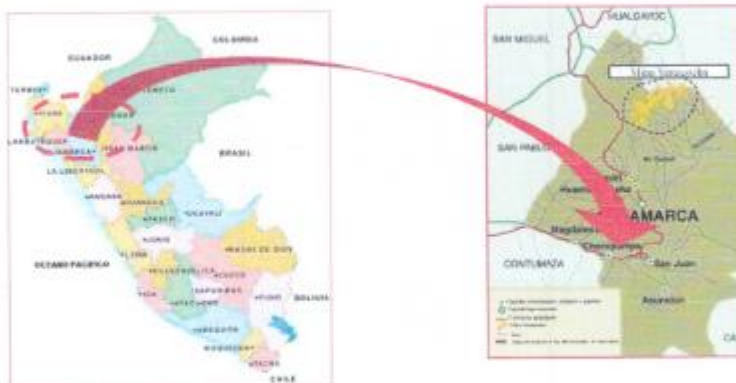
Imagen 01: Mapa de Ubicación del Proyecto

El Distrito de Choropampa, ubicada en el Departamento de Cajamarca, bajo la administración del Gobierno regional de Cajamarca, en el norte del Perú. Limita por el norte con el Distrito de Chimban; por el este con los distritos de Camporredondo y Ocalli de la provincia de Luya; por el sur con los distritos de Cortegana (Celendín) y Chadín; y por el oeste con el Distrito de Tacabamba.