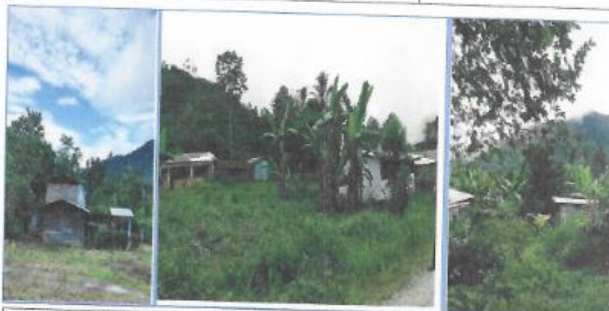
Viviendas sin servicio de agua potable y UBS