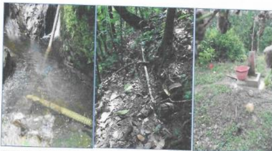
Captación de agua potable realizado por la población con recursos propios en malas condiciones