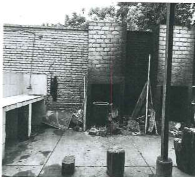
Área de menudencia

Calle Elias Aguirre N. ° 229 - Reque | Tel.: 074 - 451262 https://munireque.gob.pe/