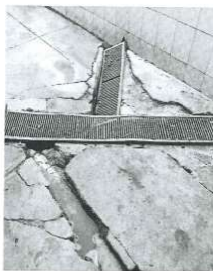
Sala de beneficio porcino

Calle Elias Aguirre N. ° 229 - Reque | Tel: 074 - 451262 https://munireque.gob.pe/