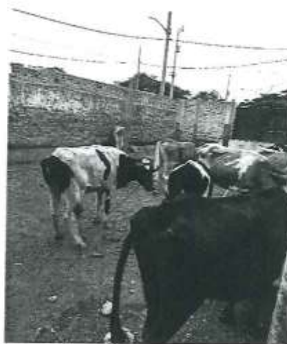
Acceso a corral