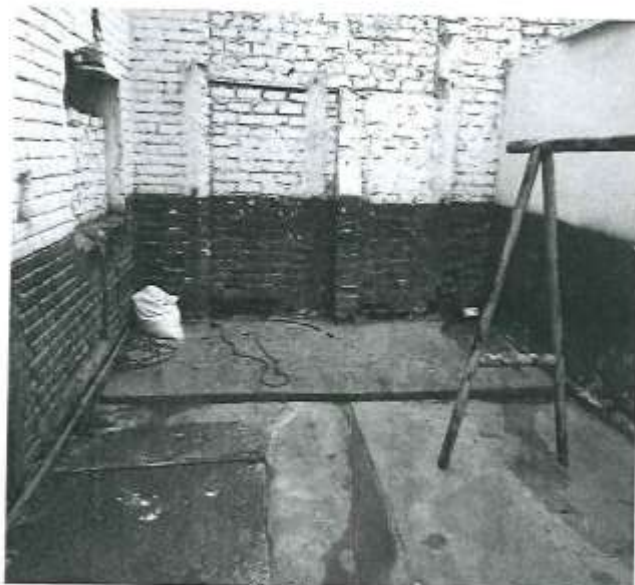
Área de cueros

Gerencia de Desarrollo Territorial e Infraestructura