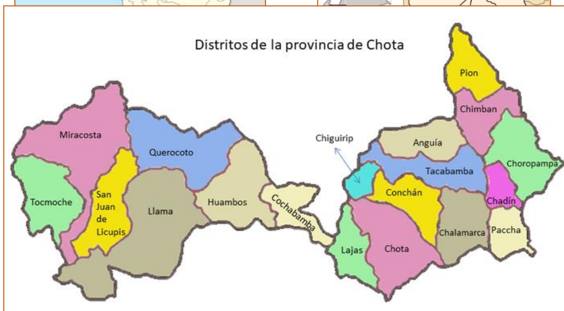
ción Distrital de Chota