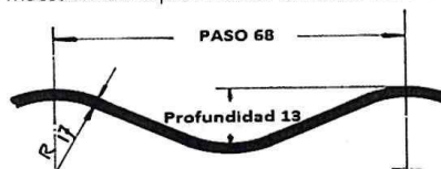
Figura 1. Dimensiones de la corruga 68 mm x 13 mm

Las corrugas de las planchas debe formar curvas suaves continuas. La corruga esta designada por el paso (distancia de cresta a cresta) y la profundidad de la corruga. Tal como se muestra en la Figura 1. El tamaño nominal de la corruga es 68 mm x 13 mm para las alcantarillas TMC Mini Múltiple SP MP-68. En Tabla 4 se muestran los requerimientos dimensionales referentes a la corruga.