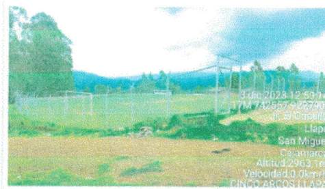
Vista N° 3: Nos muestra una vista desde la tribuna límite entre Norte y Occidente en el campo de fútbol existente donde se ejecutará el Proyecto.

Consultoría y Ejecución de Obras, Alquiler de Maquinaria y Equipos Suministro de Materiales, Servicios en General.