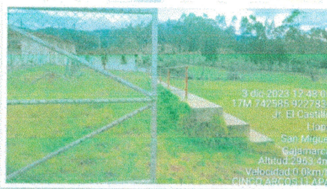
Vista N° 4: Nos muestra una vista desde la tribuna límite entre Norte y Oriente en el campo de fútbol existente donde se ejecutará el Proyecto.