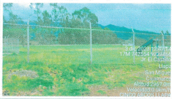
Vista N° 2: Nos muestra una vista panorámica del Terreno donde se ejecutará el Proyecto.