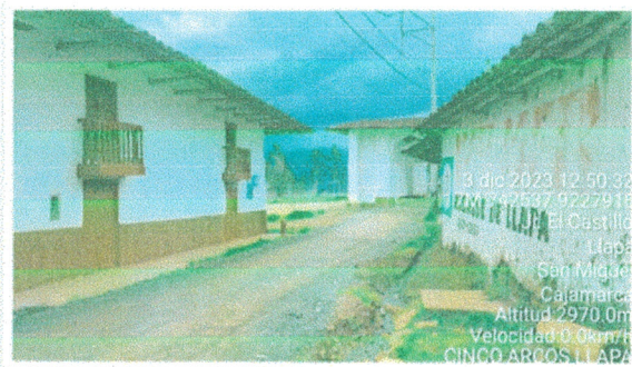
Vista N° 1: Nos muestra El Ingreso al Barrio los Cinco Arcos por la parte del Cementerio General del Distrito de Llapa.