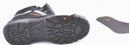
PLANTILLA FLEXIBLE ANTICLAVO