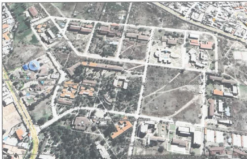
Gráfico 2 Área Urbana De La Zona Del Proyecto