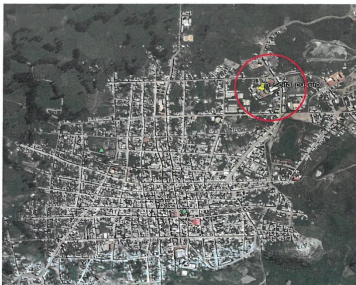
Fotografía N° 1: Vista aérea del Hospital de Puquio (circulo rojo)