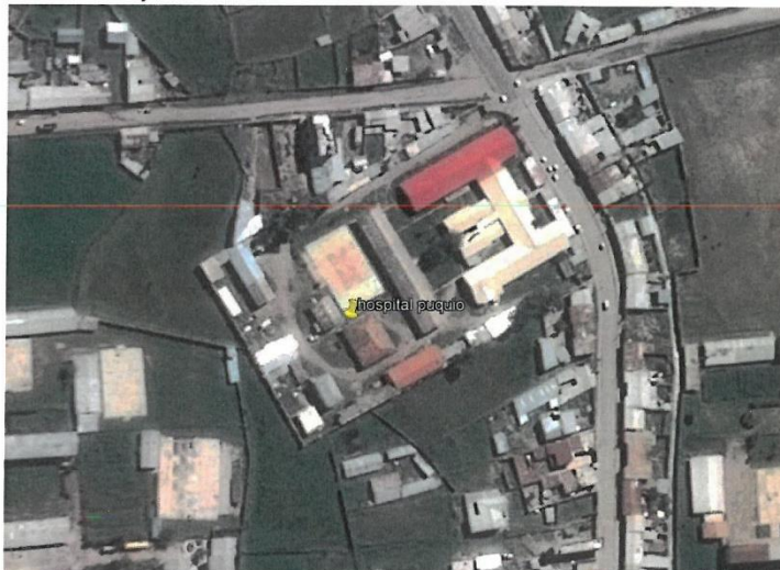
Fotografía N° 2: Vista aérea del Hospital de Puquio

El terreno mencionado presenta un área total de 13,883.40m 2 según partida registral de la SUNARP; según el levantamiento topográfico realizado en el mes de marzo del 2019 el terreno presenta un área de 14,025.83m 2 y un perímetro de 485.95 ml. El Hospital Felipe Huamán Poma de Ayala se encuentra en un terreno llano con pendientes suaves no mayores a 5%-6%