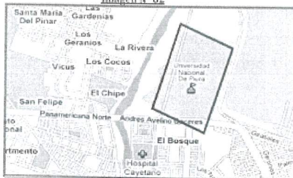
Imagen N° 02

La Universidad Nacional de Piura está ubicada en la Urb. Miraflores s/n, Castilla, Piura 295.