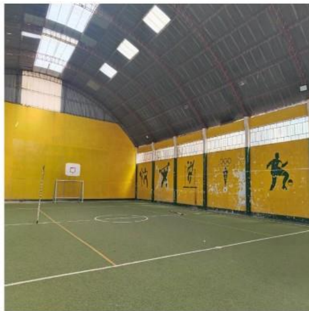
IMAGEN N° 3: IMAGEN FOTOGRAFICO DE LA INFRAESTRUCTURA EXISTENTE