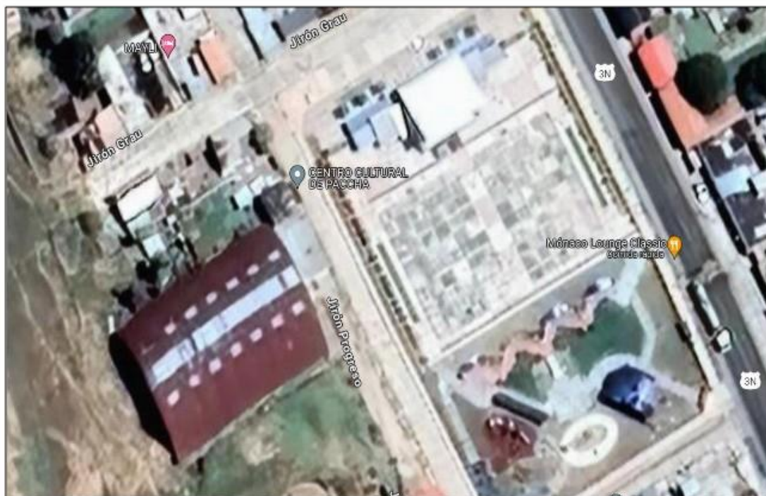
IMAGEN N° 1: UBICACIÓN VISTA SATELITAL DEL PROYECTO

Lugar : JR. PROGRESO Distrito : PACCHA Provincia : YAULI Región : JUNIN Latitud : 11°32'10. Longitud : 75°45'10. Altitud : 3740.00 m.s.n.m.