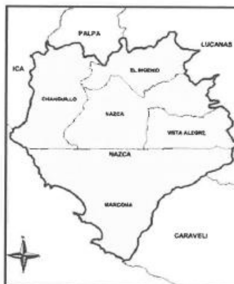
MAPA N° 1: MAPA DE MACROLOCALIZACIÓN DEL PROYECTO DE INVERSIÓN UBICACIÓN DE LA LOSA DEPORTIVA EN LA MANZANA 36, CENTRO POBLADO DE PORTACHUELOS