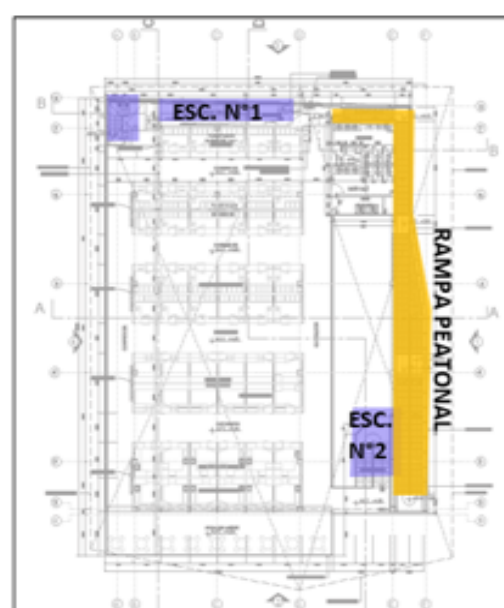
PLANTA 2° PISO