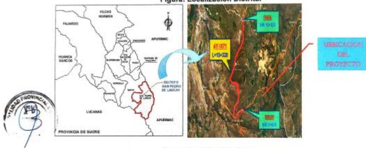
Figura: Localización Tramo