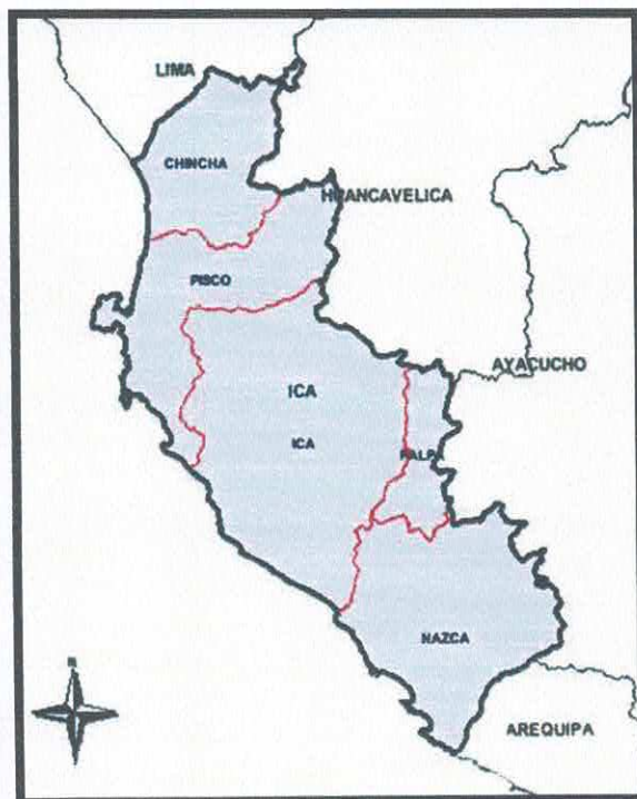
Departamento de Ica