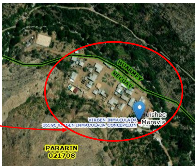
LOCALIDAD DE MARAVIA