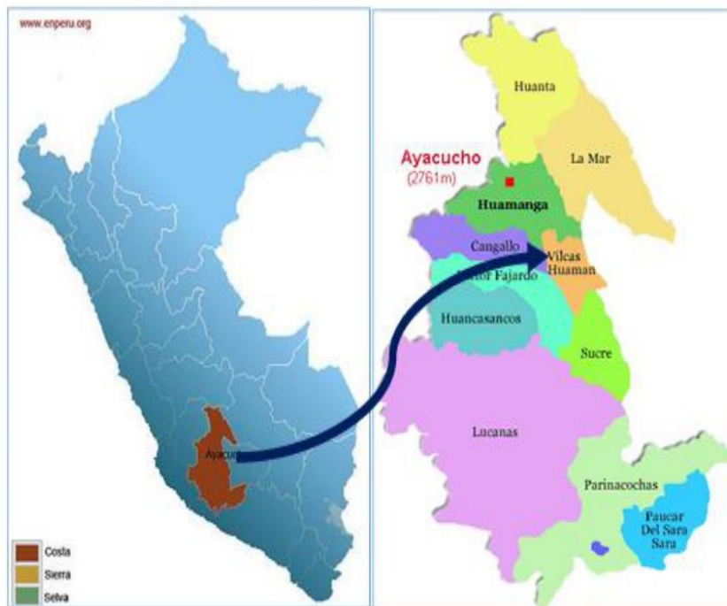
MAPA N° 01: UBICACIÓN REGIONAL Y PROVINCIAL