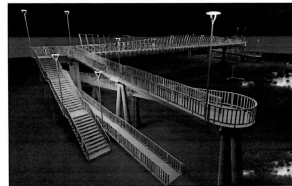
Imagen N°03.- Vista 3D del Proyecto.