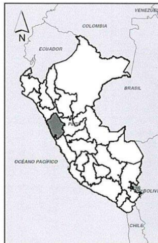
MAPA DEL PERÚ

"Decenio de la Igualdad de Oportunidades para Mujeres y Hombres" "Año del Bicentenario, de la consolidación de nuestra Independencia, y de la conmemoración de las heroicas batallas de Junín y Ayacucho"