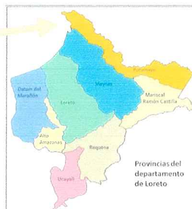
Mapa de Loreto señalando La Provincia de Putumayo