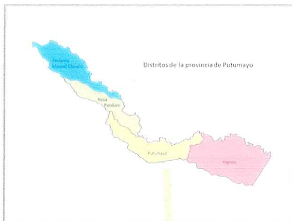
Mapa de la Provincia de Putumayo