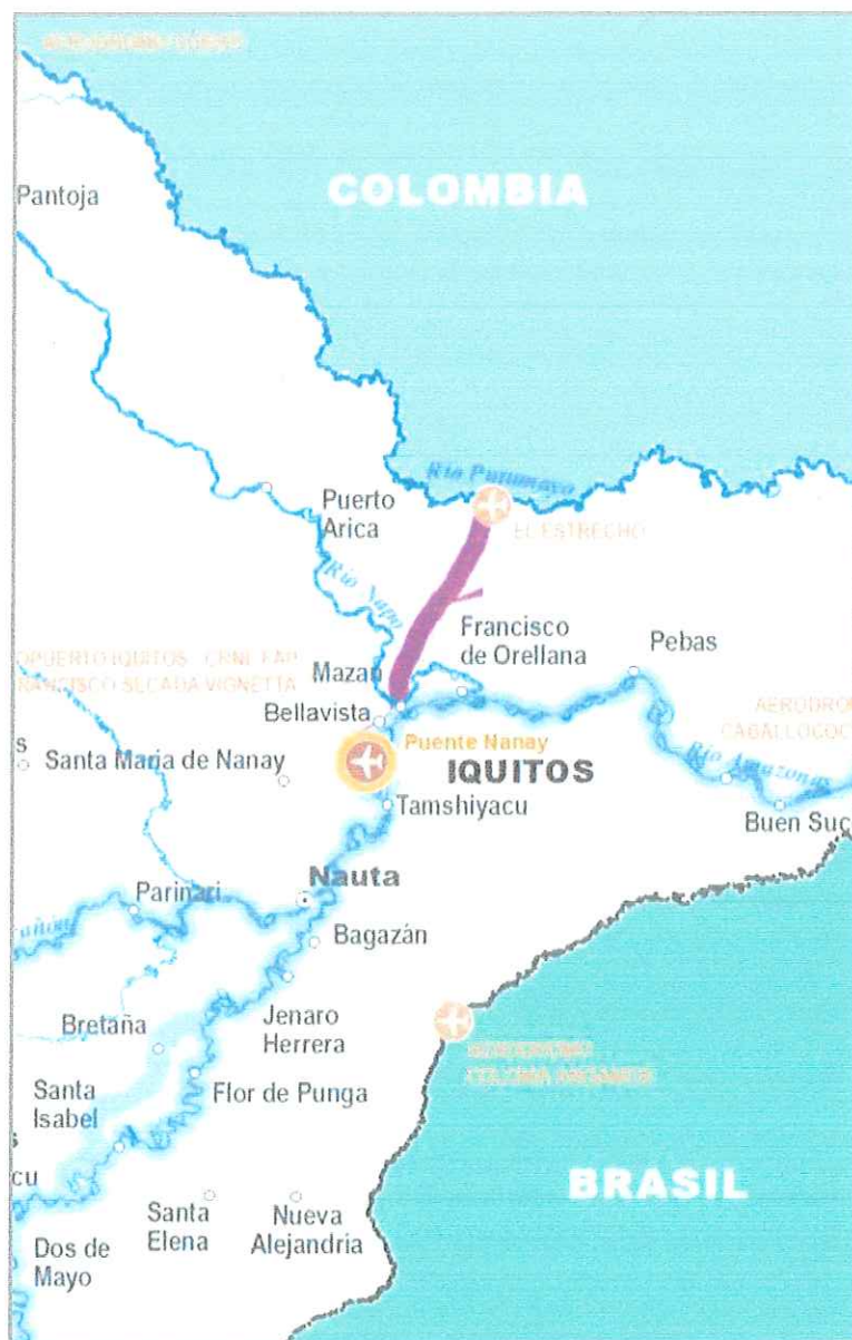
Gráfico N° 03

Acceso a la Localidad del Centro Poblado San Antonio del Estrecho