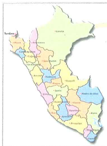
Mapa del Perú señalando el Departamento de Loreto