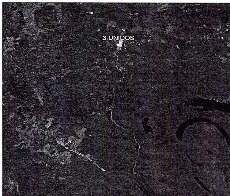
UBICACIÓN DEL CASERIO TRES UNIDOS.

La vía de acceso Al caserío Tres Unidos es por la Vía Terrestre (centro de la Ciudad a Com. Santa Clara) y Vía Fluvial (A través del Rio Nanay).