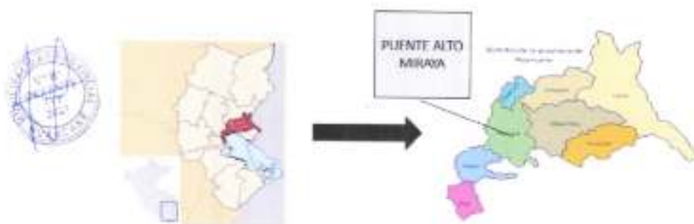
Fig. 1: Mapa político del proyecto

Región : PUNO Provincia : HUANCANE Distrito : HUANCANE Localidad : CHACOCITRCA ACOCOLLO