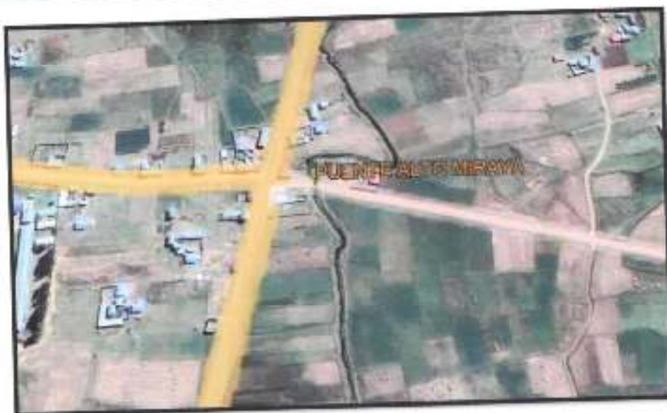
Fig. 2: Mapa geográfico del proyecto