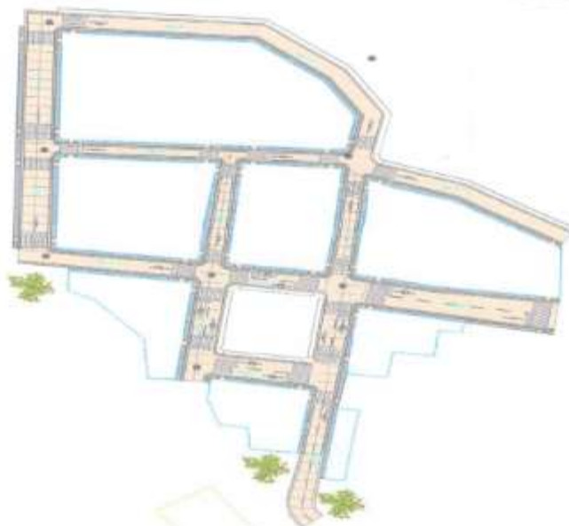
Imagen 02: Ubicación del Proyecto zona Urbana