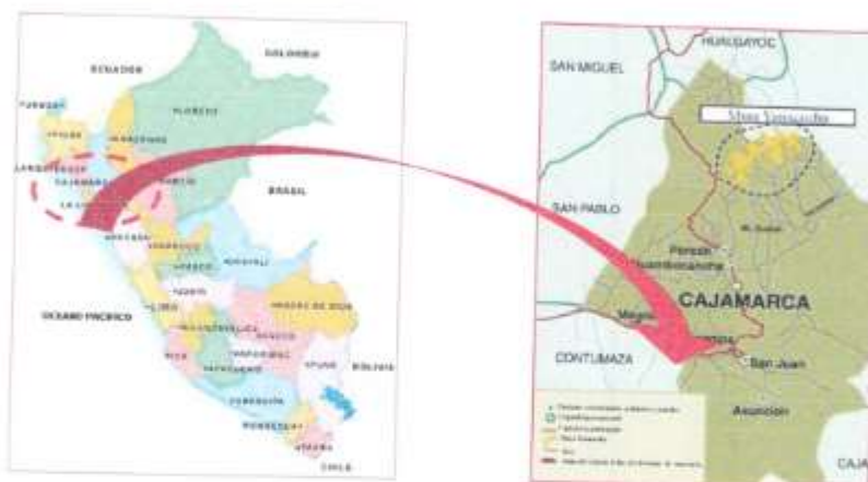
Imagen 01: Mapa de Ubicación del Proyecto

El Distrito de Choropampa, ubicada en el Departamento de Cajamarca, bajo la administración del Gobierno regional de Cajamarca, en el norte del Perú. Limita por el norte con el Distrito de Chimban; por el este con los distritos de Camporredondo y Ocalli de la provincia de Luya; por el sur con los distritos de Cortegana (Celendín) y Chadín; y por el oeste con el Distrito de Tacabamba.