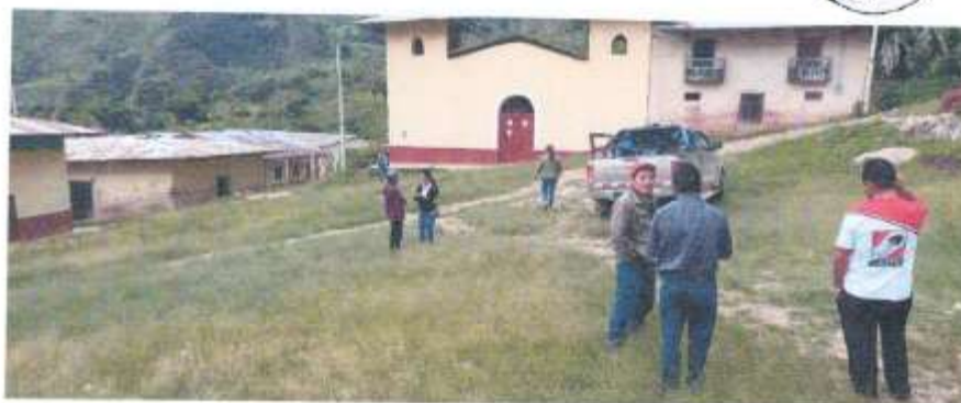
Imagen 03: Calles Que Comprenden El Proyecto

La zona del proyecto se encuentra dentro de la zona de C.P. Palco La Capilla, tiene acceso mediante el Distrito de Choropampa.