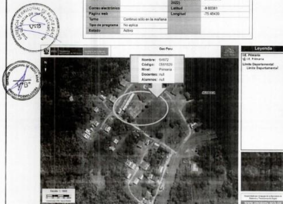
Ilustración 1. Vista Satelital de la Ubicación de la IE en el Centro Poblado Huacamayo.