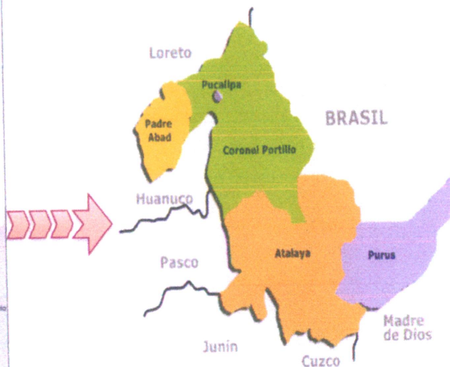
Mapa macro localización del departamento de Ucayali