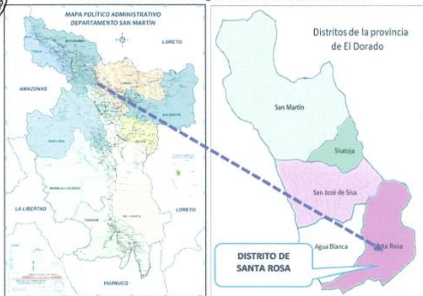
IMAGEN N° 4: Ubicación Geográfica del Distrito de Santa Rosa.