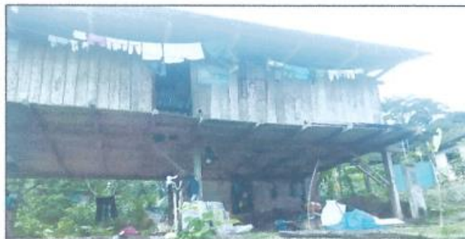
IMAGEN N° 07: VIVIENDAS EN LA LOCALIDAD SHUCSHUYACU

"Año del Bicentenario, de la consolidación de nuestra Independencia, y de la conmemoración de las heroicas batallas de Junín y Ayacucho"