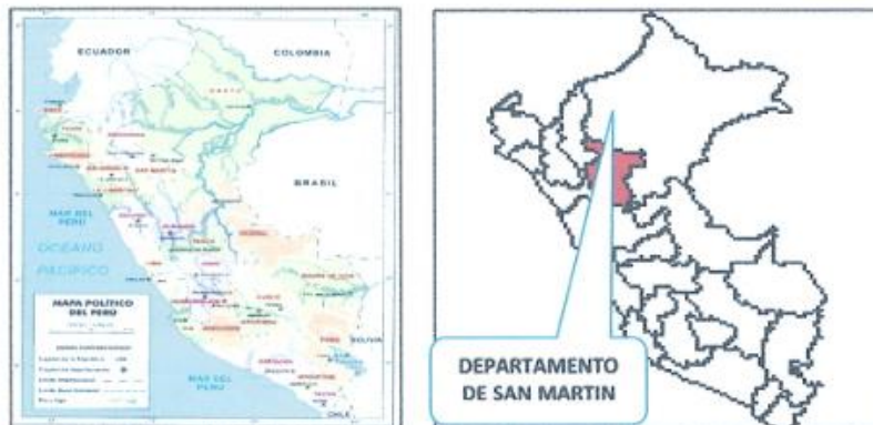
IMAGEN N° 2: Ubicación Geográfica de la Provincia el Dorado.