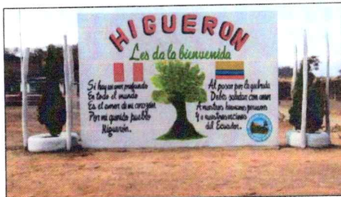
Vista N°01: Caserío de El Higuero