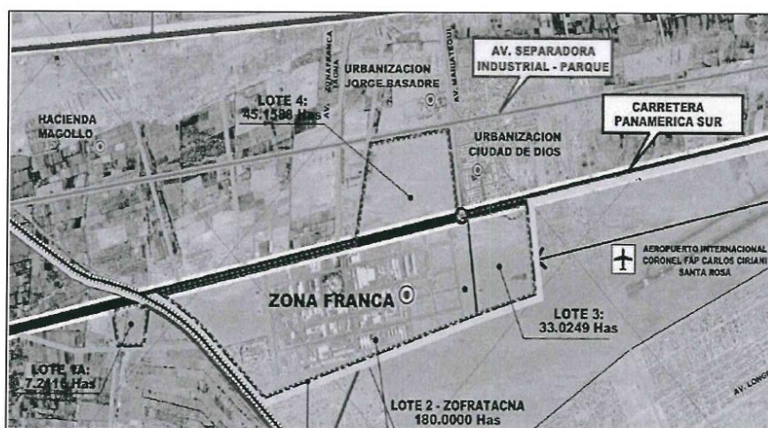
Ilustración 2: Micro localización