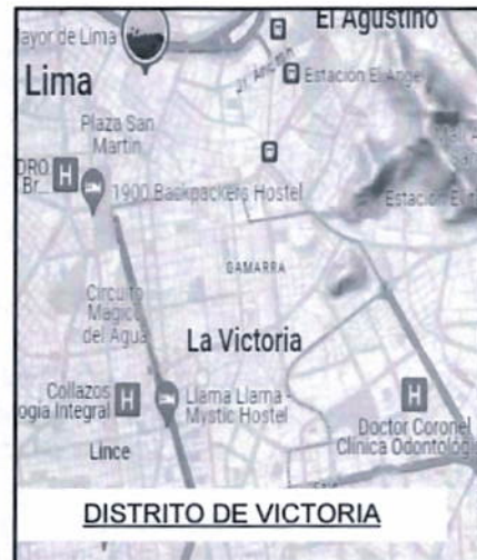
DISTRITO DE VICTORIA