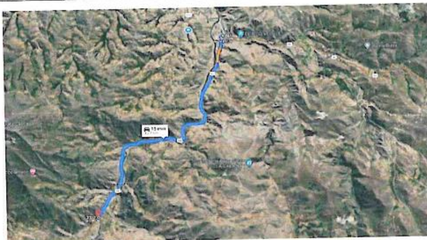
Imagen: Ubicación del Proyecto.