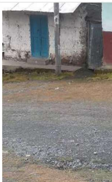
Estructuras en el AMT A4509, requieren su mejoramiento, por cumplir vida útil o incumplimiento de DMS

Los alcances no son limitativos, si durante el diagnóstico de la unidad productora, El Consultor identifica mayores deficiencias, deberá incluirlas en la alternativa de solución que plantee; sin perjuicio a lo indicado, en el estudio se debe considerar aproximadamente lo siguiente para los proyectos que involucran los alimentadores: