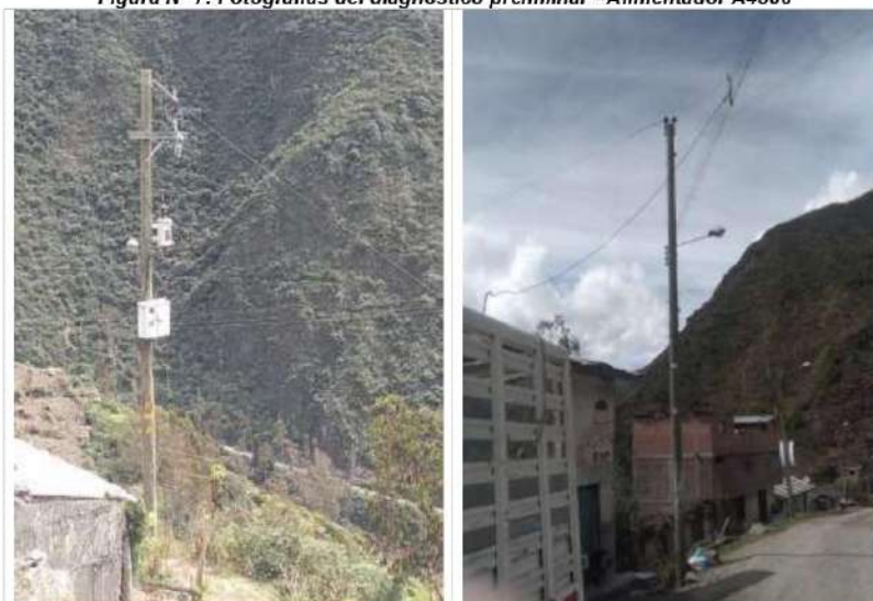
Figura N° 7: Fotografías del diagnóstico preliminar - Alimentador A4506

A continuación, se muestran algunas imágenes del estado situacional por alimentadores: