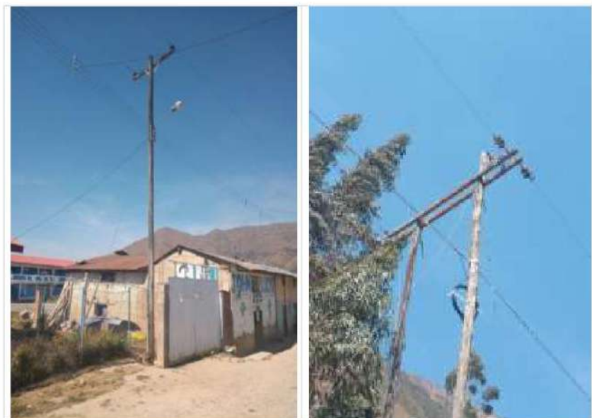
Estructuras en el AMT A4507, requieren su mejoramiento, por cumplir su vida útil o incumplimiento DMS

MEJORAMIENTO DE REDES PRIMARIAS, SEDS Y REDES SECUNDARIAS DE LOS ALIMENTADORES A4506, A4507, A4508 Y A4509, SET COMAS, PROVINCIA DE CONCEPCION, DEPARTAMENTO JUNIN"