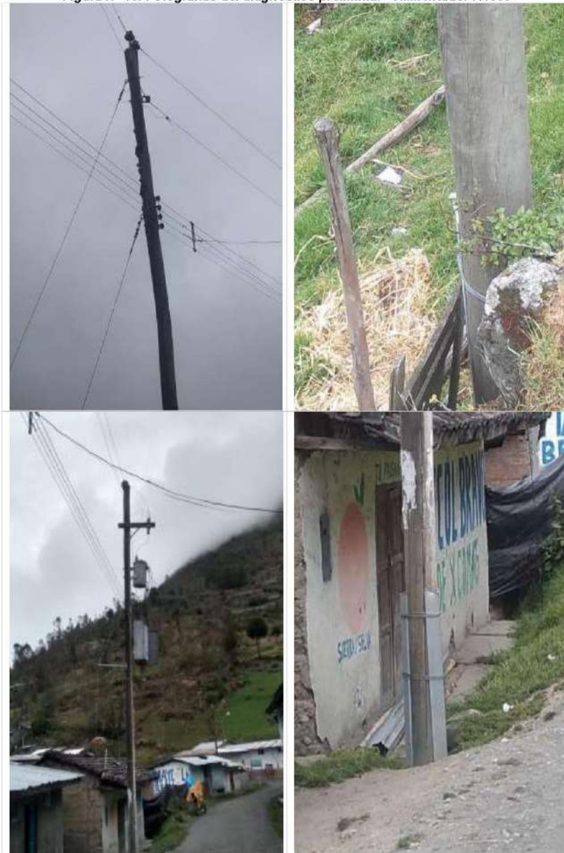
Figura N° 10: Fotografías del diagnóstico preliminar - Alimentador A4509

MEJORAMIENTO DE REDES PRIMARIAS, SEDS Y REDES SECUNDARIAS DE LOS ALIMENTADORES A4506, A4507, A4508 Y A4509, SET COMAS, PROVINCIA DE CONCEPCION, DEPARTAMENTO JUNIN"