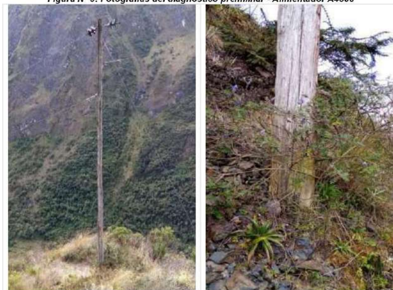
Figura N° 9: Fotografías del diagnóstico preliminar - Alimentador A4508