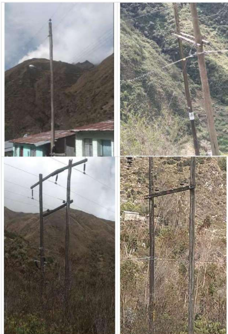
Estructuras en el AMT A4506, requieren su mejoramiento, por haber cumplido su vida útil o incumplimiento de DMS

MEJORAMIENTO DE REDES PRIMARIAS, SEDS Y REDES SECUNDARIAS DE LOS ALIMENTADORES A4506, A4507, A4508 Y A4509, SET COMAS, PROVINCIA DE CONCEPCION, DEPARTAMENTO JUNIN"