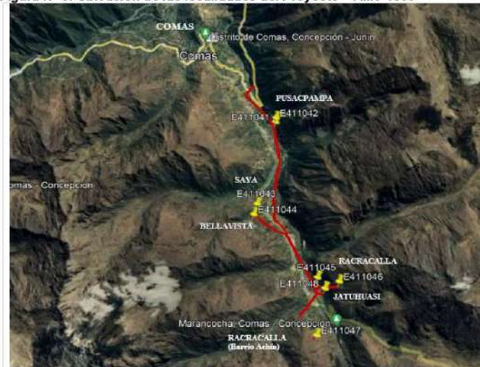
Figura N° 5: Ubicación de las localidades del Proyecto – AMT 4509

Las principales vías de acceso a la zona del proyecto son las siguientes: