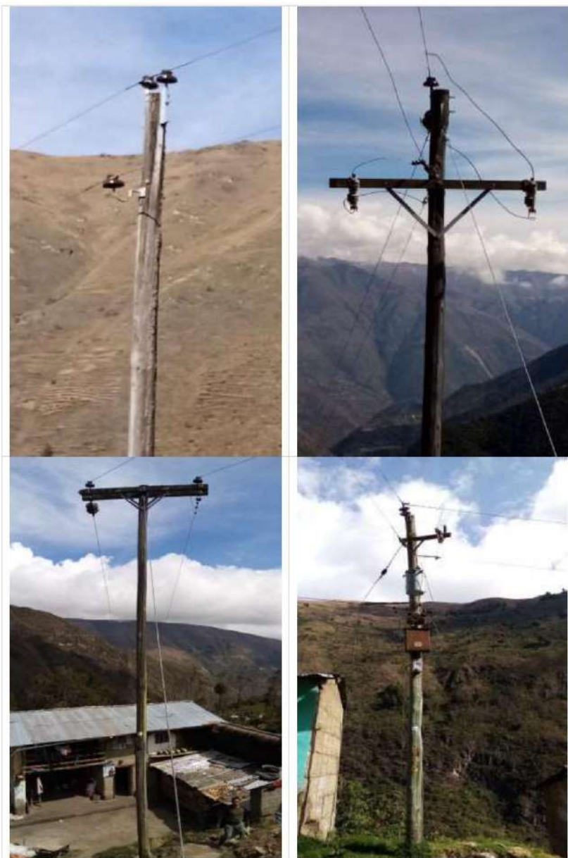
Estructuras en el AMT A4508, requieren su mejoramiento, por cumplir vida útil o incumplimiento de DMS

MEJORAMIENTO DE REDES PRIMARIAS, SEDS Y REDES SECUNDARIAS DE LOS ALIMENTADORES A4506, A4507, A4508 Y A4509, SET COMAS, PROVINCIA DE CONCEPCION, DEPARTAMENTO JUNIN"