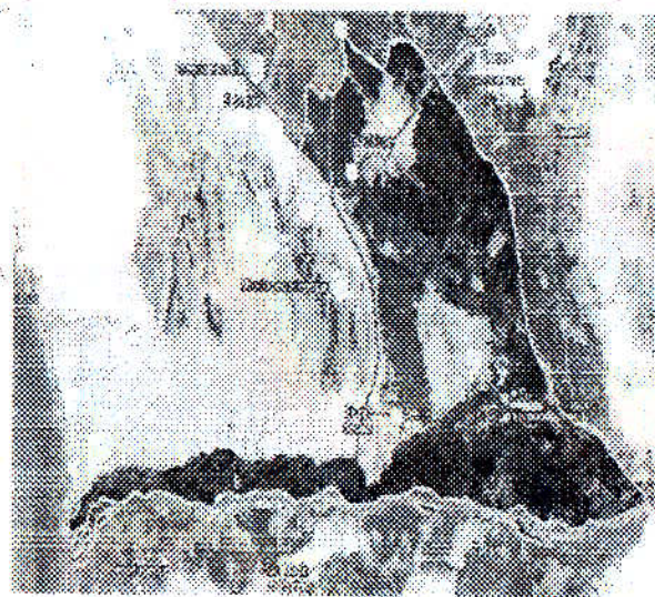
IMAGEN SATELICAL DEL DISTRITO DE GUADALUPE