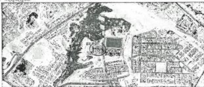
(Imagen Satelital de la ubicación del Proyecto)

En los Horarios de lunes a viernes entre las 8:00 am y las 16:00 pm y los sábados entre las 8:00 am y 12:00 pm