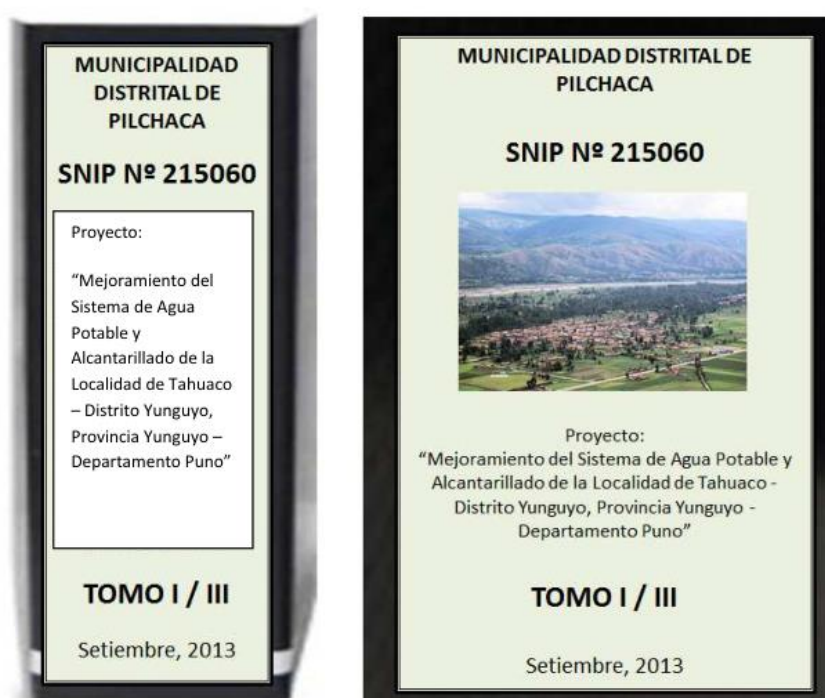
Figura 1. Forma de presentación del Expediente

que dichas carátulas, deberán indicar como mínimo, lo indicado en la figura 1.