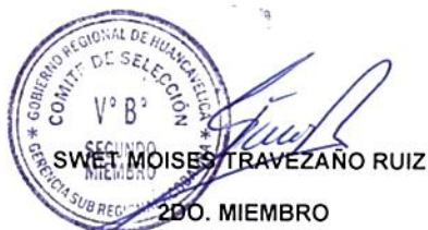
SWET MOISES TRAVEZANO RUIZ