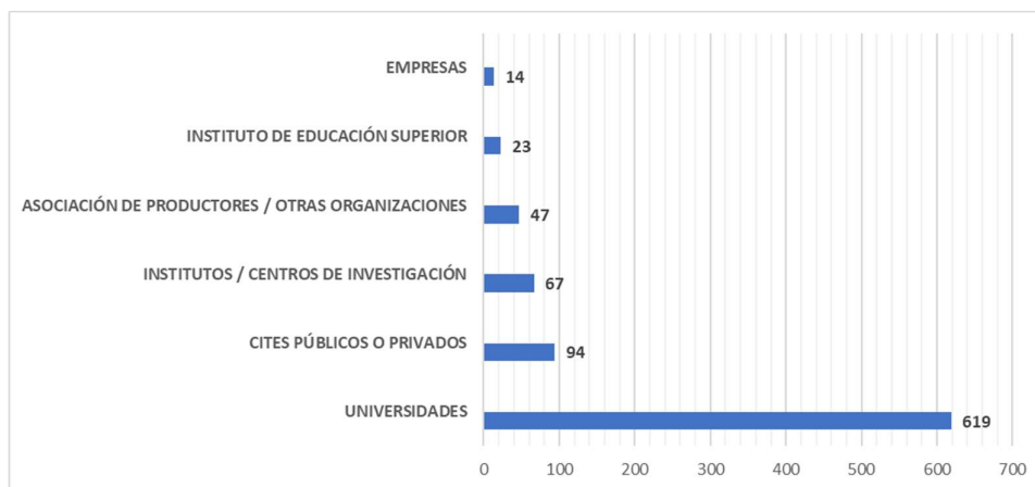
Figura 1: Total de proyectos por tipo de entidad asociada - Contrato de Préstamo N° 3700/OC-PE

De la revisión de asociatividad en los proyectos totales postulados (1164) a los concursos de Innovación Empresarial (Contrato de Préstamo N° 3700/OC-PE), obtenemos como resultado que el 74.1% (864) de proyectos postulan en asociación con otras entidades. Del total de proyectos que postulan con entidades asociadas (864), el 71.64% de proyectos postulan asociadas con una universidad, seguido de un 10.88% de proyectos asociados con un CITE, un 7.75% (67) asociados con un instituto o centro de investigación, 5.44% (47) asociados con asociaciones de productores, un 2.66 % (23) con institutos de educación superior y un 1.62% (14) asociados con otras empresas.