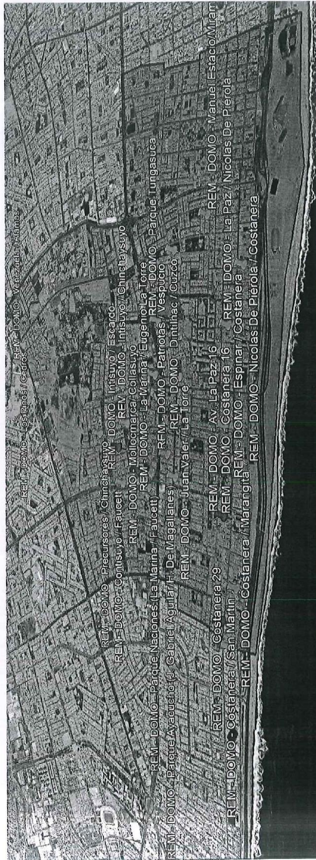
Plano de ubicación de cámaras a reemplazarse

Plano de ubicación de cámaras a reemplazarse: