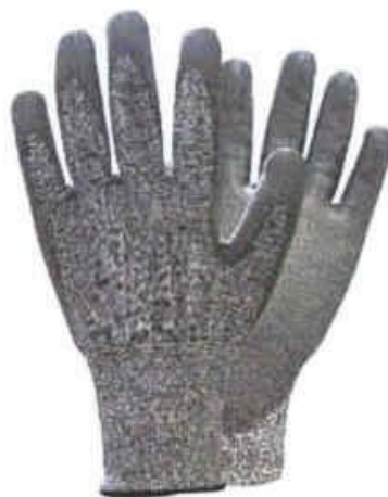
GUANTES DE TRABAJO