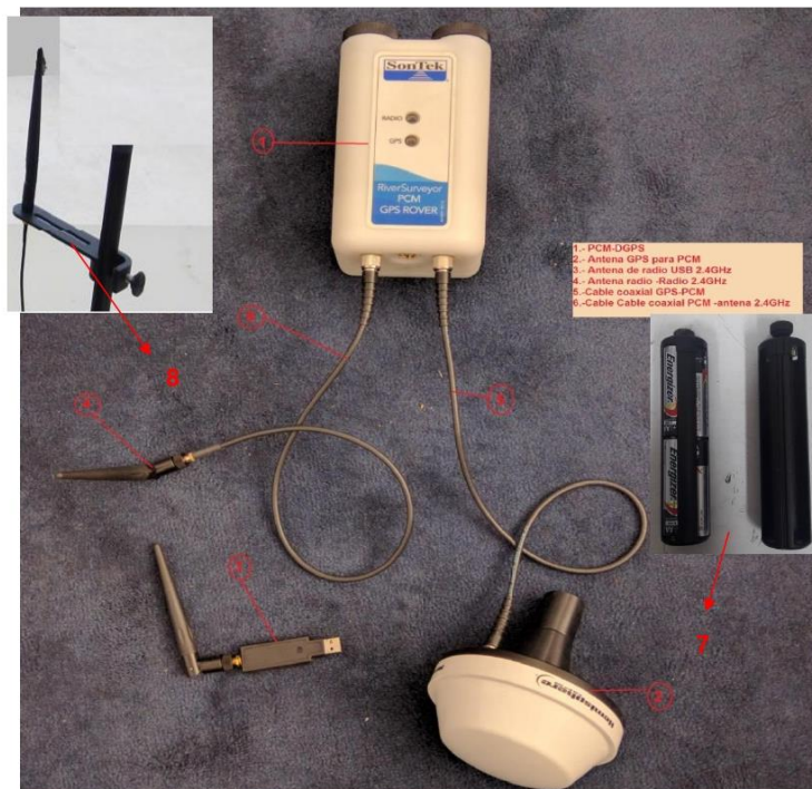
FIGURA N°01: Componentes Principales externos del correntómetro ADCP

"Decenio de la Igualdad de Oportunidades para Mujeres y Hombres" "Año de la unidad, la paz y el desarrollo"