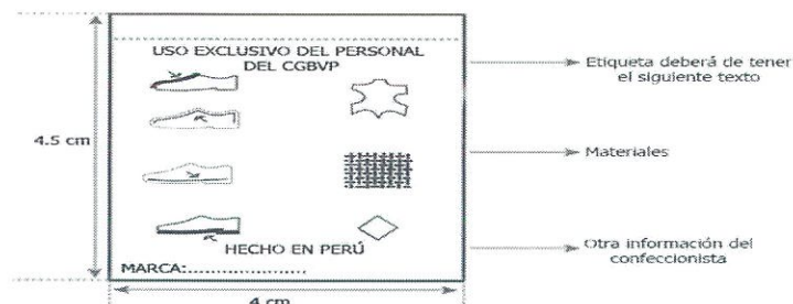
Imagen Referencial N° 01 - Etiqueta(s)