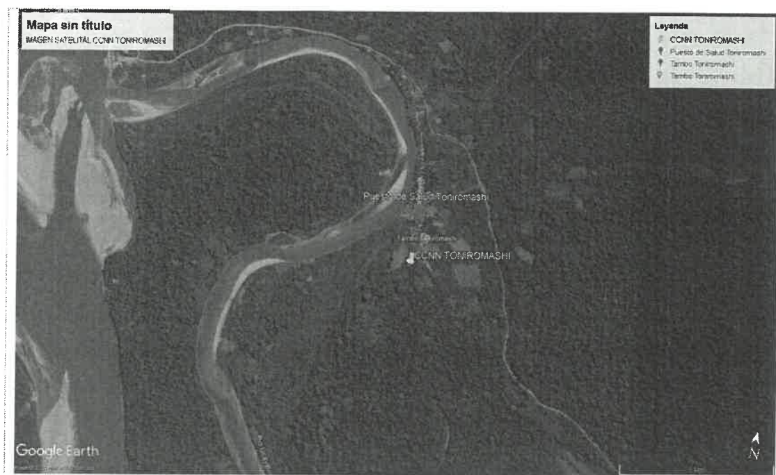
Figura 2: Vista satelital de la Comunidad Nativa TONIROMASHI.