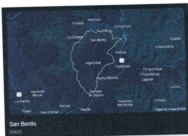
Figura 05: Mapa del Distrito de San Benito.