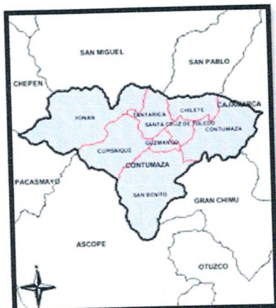
Figura 04: Mapa de la Provincia de Contumaza.