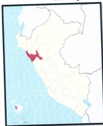
Figura 02: Mapa Departamental del Perú.