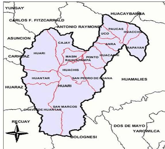
DISTRITO CHAVIN DE HUANTAR