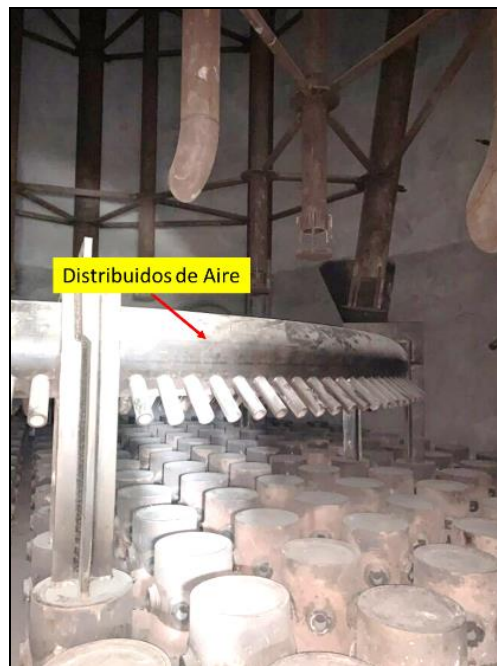
Trim air y vapor cap