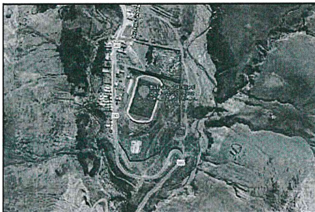
Ubicación del Estadio Municipal Castrovirreyna.

El centro deportivo se encuentra ubicado en la Av. San Martín y Av. Los Libertadores S/N en el barrio de Chacapampa, del sector Yuracrumi en el distrito de Castrovirreyna, provincia de Castrovirreyna, departamento de Huancavelica.