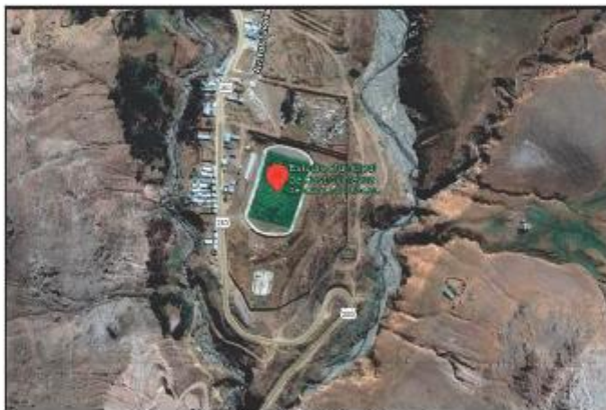
Ubicación del Estadio Municipal Castrovirreyna.

El centro deportivo se encuentra ubicado en la Av. San Martín y Av. Los Libertadores S/N en el barrio de Chacacampa, del sector Yuraccrumi en el distrito de Castrovirreyna, provincia de Castrovirreyna, departamento de Huancavelica.