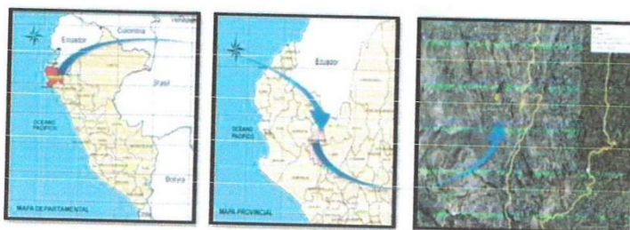
Figura N°01. Ubicación del proyecto a nivel departamental, provincial y Local